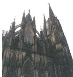
左边是科隆的地标：科隆大教堂，据说，在二战中，这座大教堂的玻璃壁画是流浪汉们冒死保护下来的。