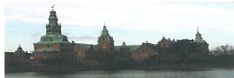
左图是瓦萨大学，右图是洛桑大学，小编怎么感觉这都是哪啊，这是大学里的么？至少个人认为左边是个教堂，右边是个和水立方差不多的体育馆。

瓦萨是芬兰西部的一座城市，但是那里几乎一半的人说的不是芬兰话而是瑞典语。而瓦萨也是芬兰通向瑞典的重要港口。（北欧港口城市，风景什么的大家都懂的，小编不解释）该城市也是座有故事的城市，建于1606年，被火焚毁于1852年。1860年重建，而瓦萨大学则是起源于1966年芬兰参议院关于在瓦萨建一座商科学校的决定。和我们学校一样，这所大学也是偏商科的，兼有文科，理工科什么的貌似离它很遥远。顺便说一句，去这所大学学习还