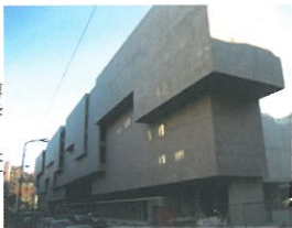
右图为博科尼大学教学楼，这楼咋长得这么有特点呢？

相比较而言，博科尼大学在中国的知名度比较有限，但这并不意味着它不够优秀。博科尼大学的毕业生在就业市场上很受欢迎，如果再说几句意大利语，在当地找工作都不会很难。不过大家也要量力而行，毕竟学意大利语还是很有挑战性的。