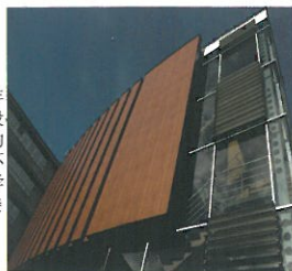
看来这年头长得没有特点的教学楼不是好大学的教学楼