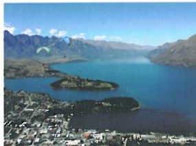
左边是皇后镇，右边是南阿尔卑斯山的一处。其实小编我也是很想在这样的环境下生活的。

为啥小编特地标注了所在国呢？因为这世界上不是只有一个坎特伯雷，正如这世界上不是只有一个名爹。新西兰的坎特伯雷大学相对于英格兰的那个更有历史一点，成立于1873年。（英格兰的那个2005年才正式更名）至于哪个更好一些，对不起大家，小编也have no