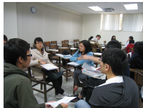
(普通心理学课堂讨论)