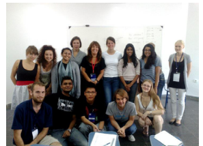
(土耳其语课后合影)